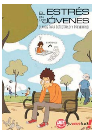
Guía "El estrés en los jóvenes. Claves para detectarlo y prevenirlo"