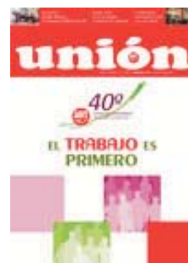
Revista Unión nº 220