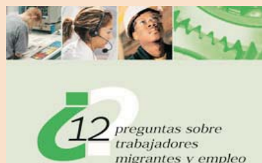
Trabajadores Migrantes y Empleo