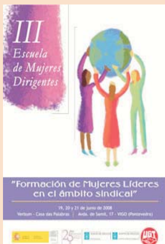
III Escuela de Mujeres Dirigentes