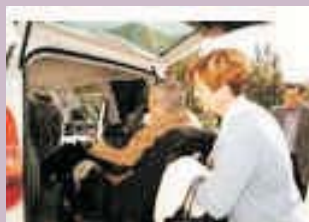
Ayudas a la Ley de Dependencia