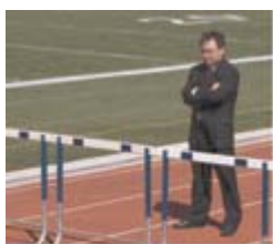
Salvando obstáculos: Pasos para mejorar los salarios y las condiciones de trabajo en la industria mundial de artículos deportivos.